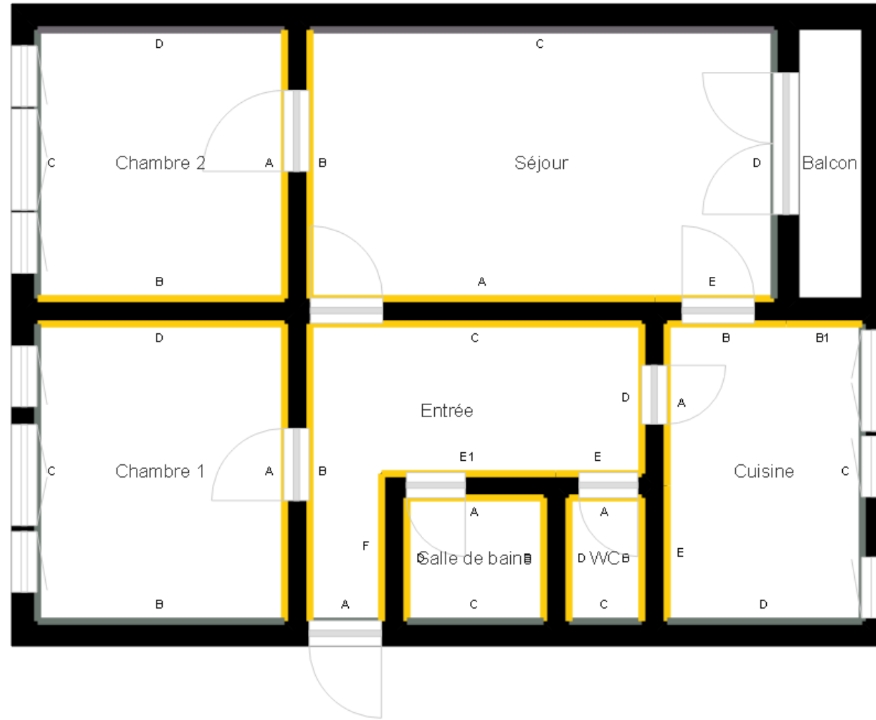
PLANCHE DE REPERAGE

Bien : 447LBI0001 - LOGT 520 19 RUE HENRI GUILLAUMET 77400 LAGNY SUR MARNE